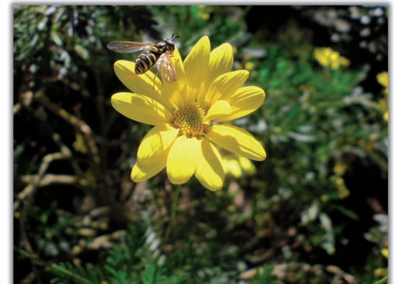
3er Premi: Xuclant el groc. Tirsia M Fábregas Granados. 17 anys. IES d'Argentona. La foto està realitzada amb una càmera Casio-exilim de 8'1 megapíxels. Es va fer practicant la funció Macro i Zoom. Passejant pel bosc vaig poder captar aquesta vespa en una flor groga en una foto molt nítida.