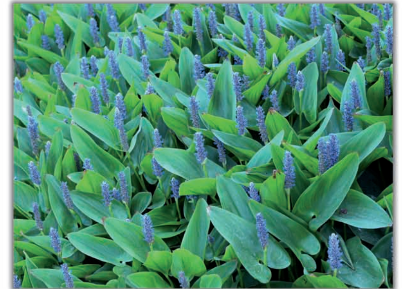
1er Premi: Blau i verd. Alba Prieto Fitó. 17 anys. Escola Mestral. Aquest contrast blau-verd correspon a una planta semisubmergida coneguda com flor d'aigua (Pontederia cordata).