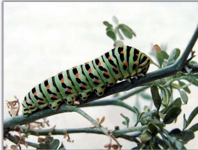
1er Premi: Voracitat i bellesa. Pol Pinyana Giner. 16 anys. Escola Mestral. Amb aquesta troballa al jardí (Corbera de Llobregat) vaig aplicar els aspectes de fotografia d'aproximació i composició que treballarem a les classes de fotografia de l'escola.