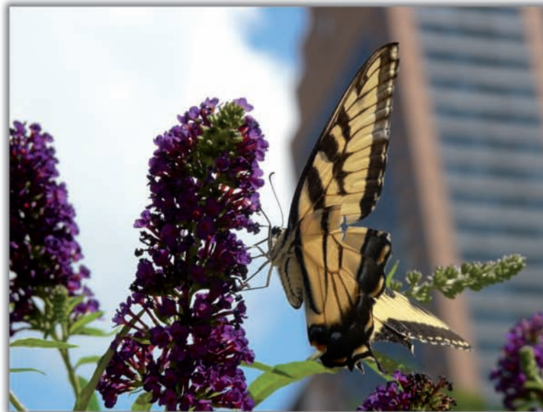
2n Premi: Natura entre gratacels. Elena Abril Carenys. 16 anys. Escola Mestral. Vaig trobar curios veure papallones enmig de tants gratacels en ple centre de Bòston. Vaig incloure aquesta imatge en el treball de fotografia per l'assignatura de biologia de l'escola.