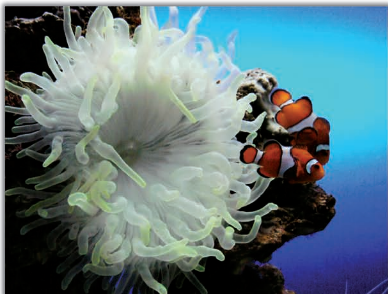
1er Premi: Anèmona i peixos pallaso. Teresa M a Aragó Fitó. 31 anys. IES Els Tres Turons. Fotografia feta a les instal·lacions de Loro Parque, a Tenerife, l'agost de 2007. Està realitzada des de l'exterior de l'aquari marí, a mà alçada. Retrata a dos peixos pallasos i a l'anèmona amb què estan en simbiosi. Càmera utilitzada: Panasonic.